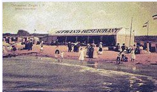
Das Strandrestaurant um das Jahr 1900

Die beiden Hauptorte von Zingst, Pahlen und Hanshagen, zählten schon im Jahr 1700 als eine Gemeinde und hatten nur einen Schulzen. Pahlen lag im Südwesten des jetzigen Ortes und Hanshagen im Gebiet um den Hafen. Im Jahr 1823 entstand durch die Zusammenlegung der Orte Pahlen , Hanshagen und Am Rothem Haus der jetzige Ort Zingst.