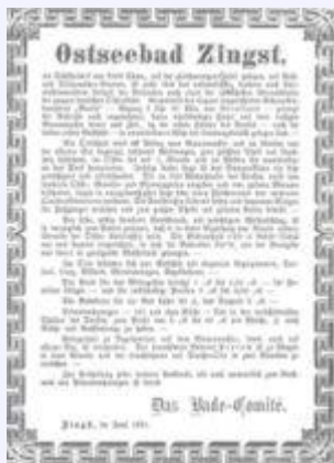
Tourismuswerbung aus dem Jahr 1881