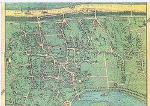
Ortsplan von Zingst um das Jahr 1900