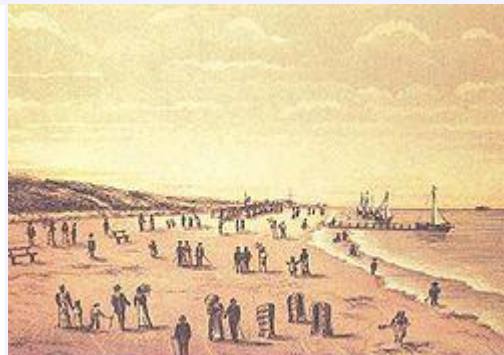
Der Strand um das Jahr 1890